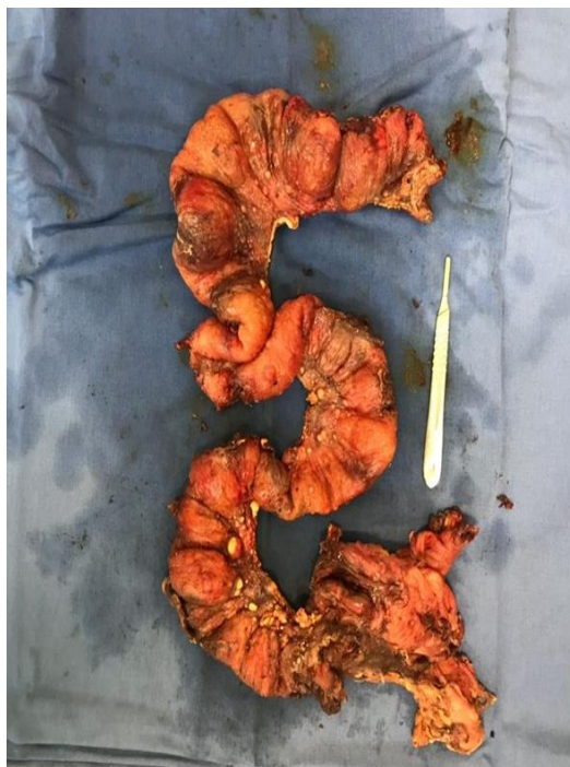
Figura 1. Material cirúrgico de ressecção intestinal – colectomia direita ampliada

Após drenagem, o paciente evoluiu bem e referiu melhora da dor abdominal, recebendo alta da equipe da Cirurgia Geral. Manteve-se internado em tratamento para tuberculose, sendo orientado acompanhamento ambulatorial pela Cirurgia Geral para seguimento e reconstrução de trânsito intestinal.